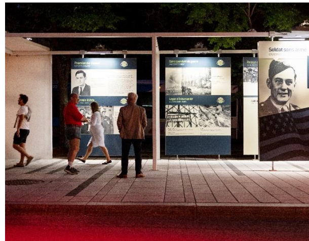
Parcours René Lévesque, PQDS