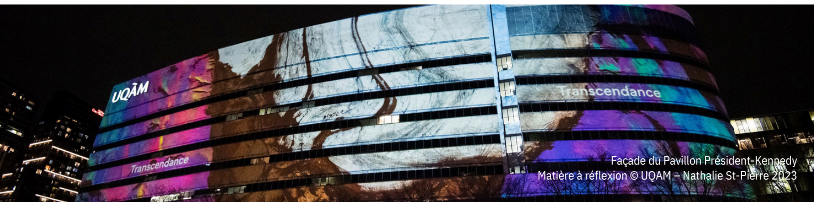
Façade du Pavillon Président-Kennedy Matière à réflexion

Un plan schématique de la toile de fibre optique opéré par le PQDS est disponible ici: Carte réseau fibre optique