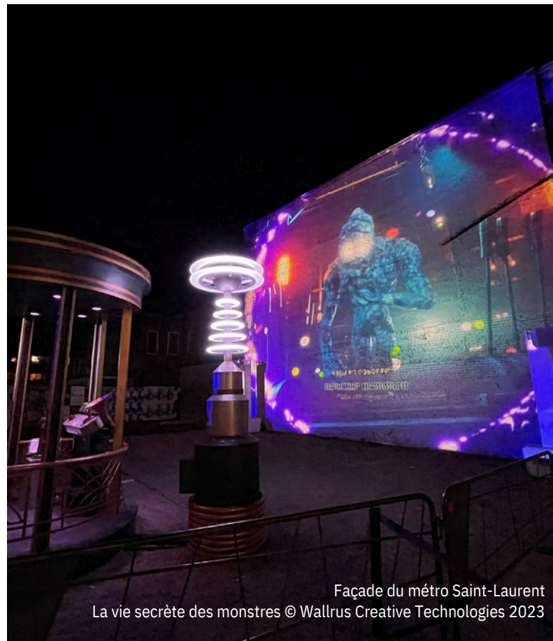
Façade du métro Saint-Laurent La vie secrète des monstres © Wallrus Creative Technologies 2023

Vous avez d'autres questions concernant les vidéoprojections dans les espaces publics du Quartier des spectacles ? Veuillez écrire à l'adresse suivante : videoprojections@quartierdesspectacles.com